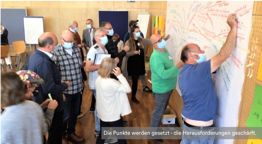
Die Punkte werden gesetzt - die Herausforderungen geschäft.