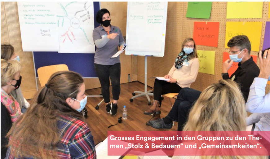
Grosses Engagement in den Gruppen zu den Themen „Stolz & Bedauern“ und „Gemeinsamkeiten“.

Auf der Sollseite werden z.B. fehlende Zeit, Zeitdruck, Dokumentationszwang und Informationsflut, mit der Vergangenheit abschliessen, fehlende Aussenwirkung in der Region, das Zuweisen von Personen über 65 Jahren, Abgrenzung zur Klinik Münsterlingen, personelle und finanzielle Kapazitätsgrenzen bis hin zu personellen Fluktuationen genannt. Die Aufzählung ist lediglich ein Auszug und zeigt auf in welchem Spannungsfeld sich die Mansio bewegt.